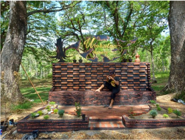
Gambar 6. Proses Pengembangan Fasilitas Outbond dan Ikon Umbulan Karang