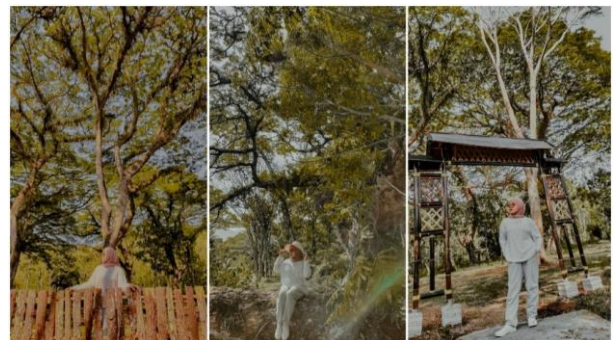
Gambar 2. Branding desa dengan konsep Ecotourism

Di dalam sebuah desa wisata perlu adanya spot wisata dan branding yang inovatif, kreatif, dan unik untuk berkunjung. Spot wisata ini juga memanfaatkan potensi yang ada dalam sebuah desa wisata. Di Umbulan Karang ini memiliki potensi lahan yang cukup luas, sehingga Tim PPK Ormawa menambah spot wisata berupa outbound , altar, icons umbulan, camping ground , dan spot foto. Untuk menyukkseskan spot wisata tersebut tentunya diperlukan pengarah dan pendamping seperti trainer camping dan tour guide untuk memberikan pelayanan yang optimal kepada pengunjung yang datang. Hal tersebut dimaksudkan supaya tidak terjadi kesalahan dalam penggunaan spot wisata.