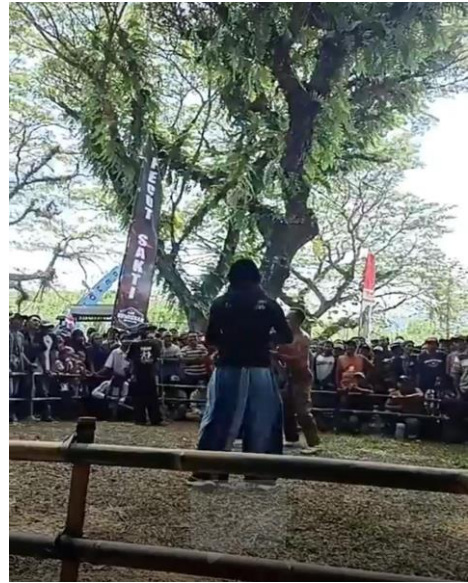
Gambar 5. Pelestarian Budaya Tiban di Umbulan

Selanjutnya Tim PPK Ormawa juga akan bekerja sama dengan biro perjalanan wisata, travel agent , dan pramuwisata membuka pintu menuju pasar yang lebih luas. Biro perjalanan dan agen wisata dapat memasarkan paket wisata Desa Wisata Umbulan kepada wisatawan domestik dan mancanegara. Pramuwisata yang berpengalaman luas tentang kekayaan alam dan budaya desa dapat memberikan pengalaman wisata yang lebih mendalam. Dalam hal ini, kerja sama dengan desa wisata lain. Asosiasi Perusahaan Perjalanan Wisata Indonesia (ASITA), dan Persatuan Hotel dan Restoran Indonesia (PHRI) akan menciptakan sinergi antarpihak terkait industri pariwisata. Pertukaran pengalaman, ide, dan dukungan dalam pemasaran bersama dapat meningkatkan visibilitas Desa Wisata Umbulan di tingkat nasional dan internasional. Dengan menjalin kemitraan yang kokoh dengan UMKM lokal, instansi pemerintah, pelaku pariwisata, dan komunitas desa lainnya, Desa Wisata Umbulan dapat memaksimalkan potensinya. Melalui kerja sama yang efektif, Desa Wisata Umbulan tidak hanya meningkatkan daya tarik wisata, tetapi juga menciptakan dampak positif dalam bentuk pemberdayaan ekonomi masyarakat, pelestarian budaya lokal, dan pengelolaan pariwisata yang berkelanjutan.