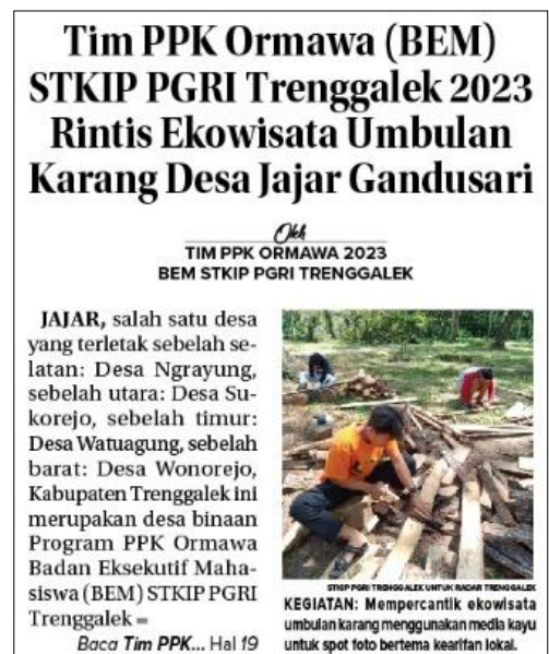
Gambar 4. Promosi wisata melalui media massa