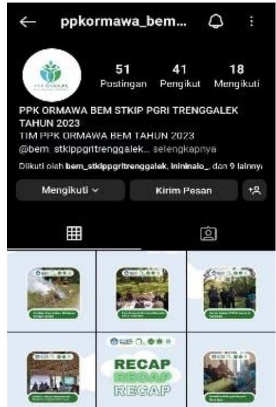
Gambar 3. Promosi wisata melalui media sosial

tentang Umbulan Karang dan kehidupan masyarakat lokal. Selain itu, pembentuk tim pengelola media sosial Desawisata atau bisa disebut dengan Community Based Tourism (CBT) dapat menjadi salah satu daya tarik utama di desa ini. Dengan kombinasi strategi digital yang cerdas dan partisipasi aktif masyarakat lokal, Desa Wisata Umbulan berhasil mempromosikan dirinya secara efektif, meningkatkan kesadaran wisatawan, dan membentuk dasar yang kokoh untuk pertumbuhan berkelanjutan dalam pariwisata lokal.